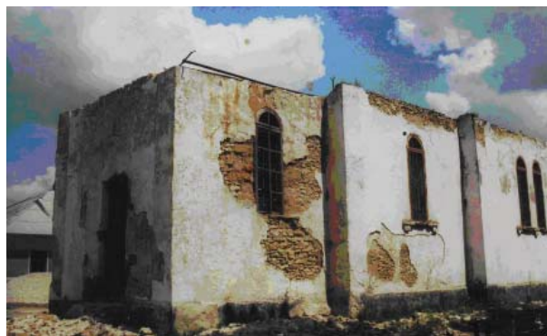
Mănăstirea Frumoasa. Ruinele bisericii cu hramul Adormirea Maicii Domnului, anii 60-70