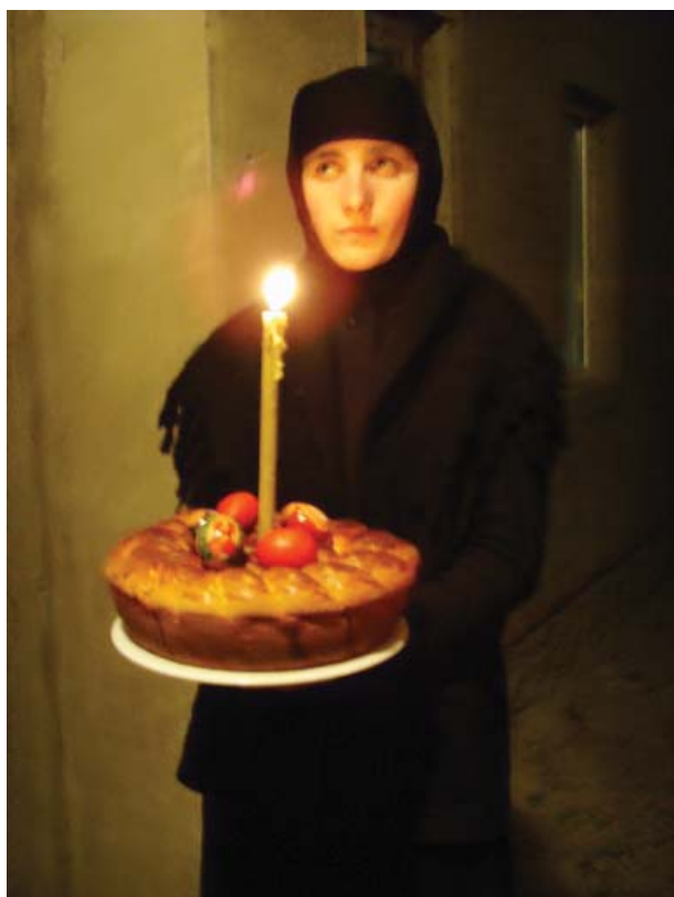
Ascultătoarea Xenia la sărbătoarea Sfințelor Paști

Cea mai prosperă perioadă din istoria mănăstirii este legată de numele arhimandritului Venedict, care a fost stareț între anii 1818-1850 și a făcut multe fapte bune. Pe timpul lui mănăstirea a devenit centru al culturii religioase și învățământului duhovnicesc. El a adunat o bibliotecă bogată și a înființat o școală duhovnicească, la care învățau copiii clericilor basarabeni, printre care și viitorul Mitropolit Iosif Naniescu al Moldovei. În anul 1840, în apropierea bisericii vechi, se zidește o clopotniță din lemn de stejar. În anul 1847 începe construcția bisericii noi, din piatră, în locul celei din lemn, care se sfințește